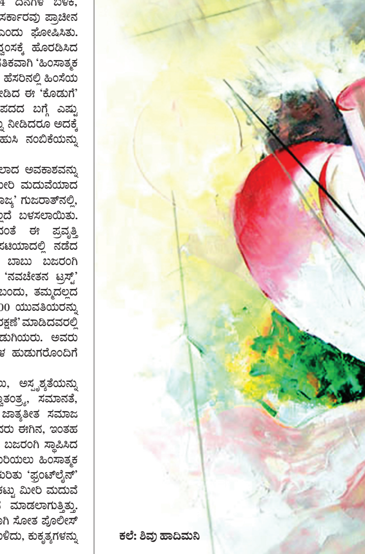
ಕಲೆ: ಶಿವು ಹಾದಿಮನಿ

ಮುಂದೆ, ಬರೋಬ್ಬರಿ ಎರಡು ವರ್ಷ, 124 ದಿನಗಳ ಬಳಿಕ, ಅಂದರೆ 2001ರ ಮಾರ್ಚ್ 2ರಂದು, ತಾಲಿಬಾನ್ ಸರ್ಕಾರವು ಪ್ರಾಚೀನ 'ಬಮಿಯನ್ ಬುದ್ಧ'ರನ್ನು ಕೇವಲ 'ವಿಗ್ರಹ'ಗಳು ಎಂದು ಘೋಷಿಸಿತು. ಆಗ ಮುಲ್ತಾ ಮೊಹಮ್ಮದ್ ಒಮರ್ ಅವುಗಳ ದ್ವಂದ್ವಕ್ಕೆ ಹೊರಡಿಸಿದ ಆದೇಶದ ಪರಿಣಾಮ 'ಜಿಹಾದ್' ಎಂಬ ಪದವು ಜಾಗೃತವಾಗಿ 'ಹಿಂಸಾತ್ಮಕ ಅಯುಧ' ಎಂಬರ್ಥವನ್ನು ಪಡೆದುಕೊಂಡಿತು. ಇನ್ನೂ ಹೆಚ್ಚಿನಲ್ಲಿ ಹಿಂಸೆಯ ಪ್ರಚೋದಕರೂ ಹಾಗೂ ರಾಜಕೀಯ ಪಟ್ಟಭದ್ರರು ನೀಡಿದ ಈ 'ಕೊಡುಗೆ' ಹೇಗಿತ್ತೆಂದರೆ 'ಜಿಹಾದ್' ಎಂಬ ಅರಬ್‌ಶಬ್ದದ ಪದದ ಬಗ್ಗೆ ಎಷ್ಟು ದೀರ್ಘವಾದ ಹಾಗೂ ವಿದ್ವತ್ಪೂರ್ಣ ವಿವರಣೆಗಳನ್ನು ನೀಡಿದರೂ ಅದಕ್ಕೆ ಅಂಟಿದ ಹೊಸ ಅರ್ಥವನ್ನು ತೋರಿಸುವುದು, ಹುಸಿ ನಂಬಿಕೆಯನ್ನು ಹೋಗಲಾಡಿಸಲು ಸಾಧ್ಯವಾಗಲೇ ಇಲ್ಲ.